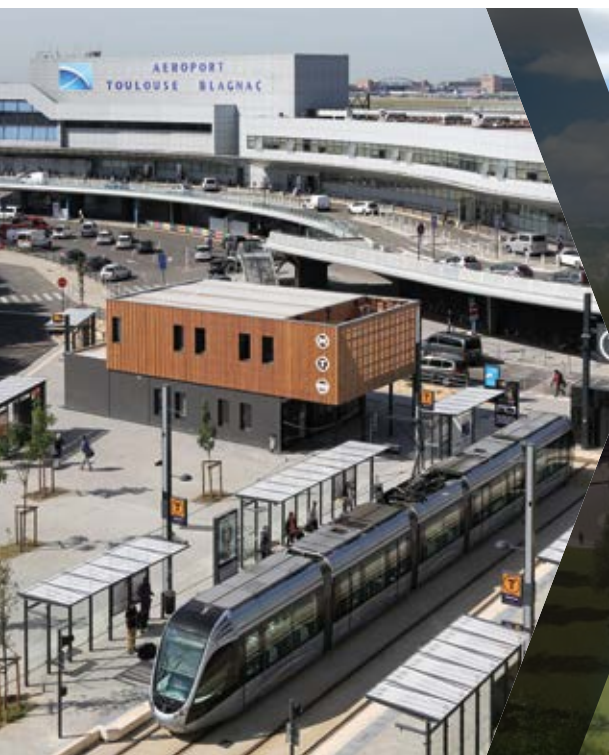
Le secteur Parvis, à l'est du Parc